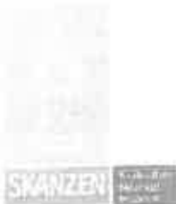
Buzás Miklós főépítész