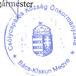
Ábrahám Fúrus János polgármester