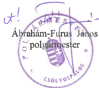
Ábrahám-Furus János polgármester